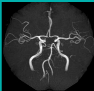
MRA 像 (磁気共鳴血管撮影検査)